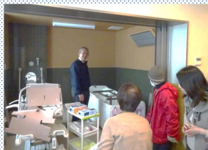
介護事業所の見学バスツアー