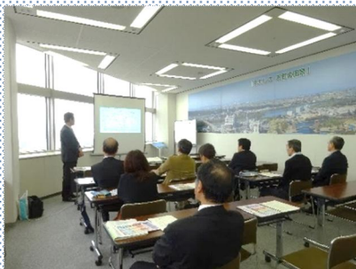
介護に関する講座(座学)

申込書のご希望の講座に○印をご記入のうえ、FAX等にてお申し込みをお願いいたします。 ご希望の内容を確認し、日程等を調整させていただきます。(人数・時間・回数等は、ご相談下さい。)