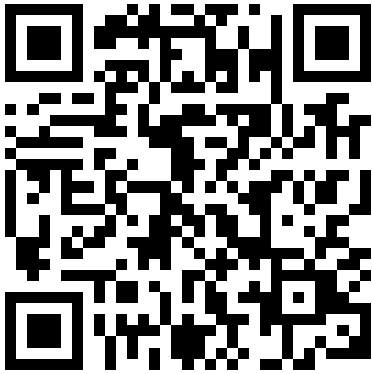
申込専用アドレス二次元コード