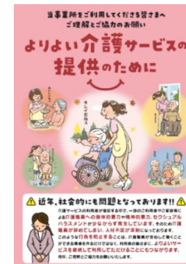
「ハートフルなこそ」様のリーフレット