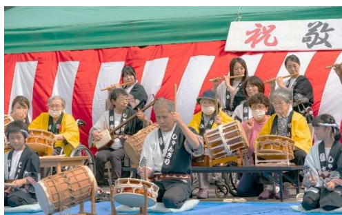
地区敬老会も招いての敬老会

社会福祉法人桜寿会 特別養護老人ホーム優雅 〒967-0004 福島県南会津郡南会津町田島字北下原 111 TEL：0241-64-5110 FAX：0241-64-5109