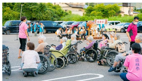
地域の若者と地域住民が参加する盆踊り

決して楽ではなく大変なことが多い仕事だと思いますが、それ以上にやりがいを感じられる瞬間が必ずあります。また、自分にとって宝物になる瞬間も必ずあります。