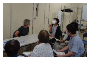
現役介護助手への質問タイム