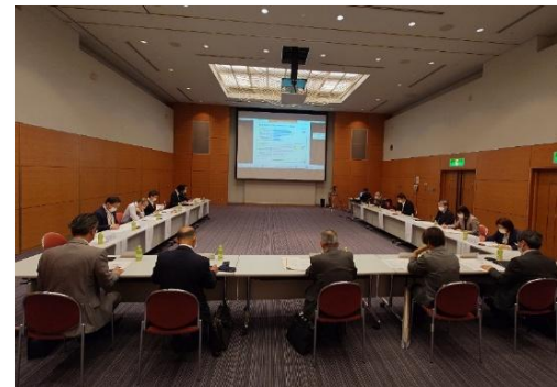
福島県介護労働懇談会の様子

労働施策総合推進法の一部改正により、すべての企業等はカスハラ防止のための具体的な措置を講じることが義務となります。福岡県での取り組みやいわき市の法人様の例を踏まえ、カスハラ対応を議論しました。