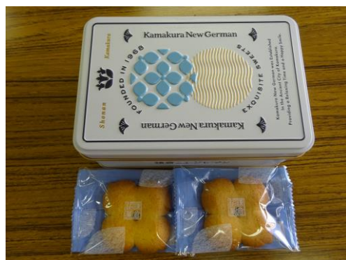
鎌倉銘菓の紫陽花風ボーロの配給がありました。 缶がステキです（ためるクセがある人は注意）