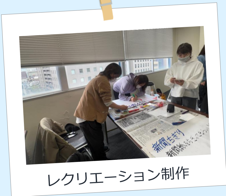
レクリエーション制作