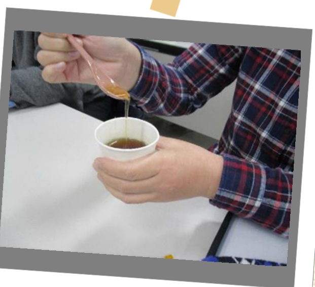
水分とろみ剤体験