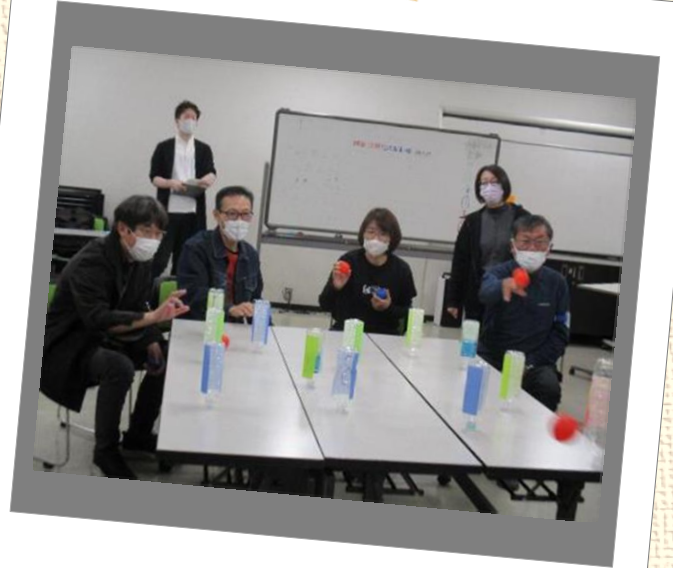
レクリエーション体験