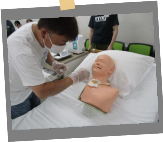
医療的ケア（喀痰吸引）