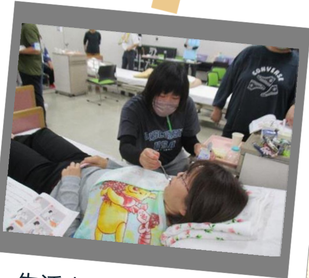
生活支援技術Ⅱ（食事介 助）