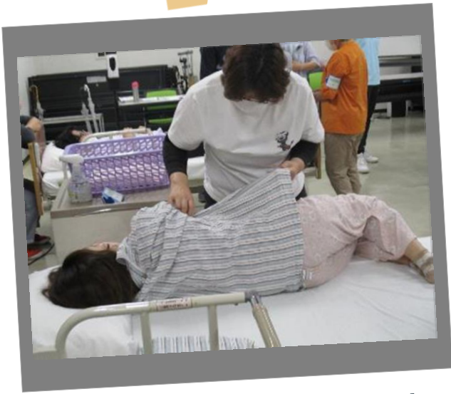
生活支援技術Ⅱ（着脱介 助）