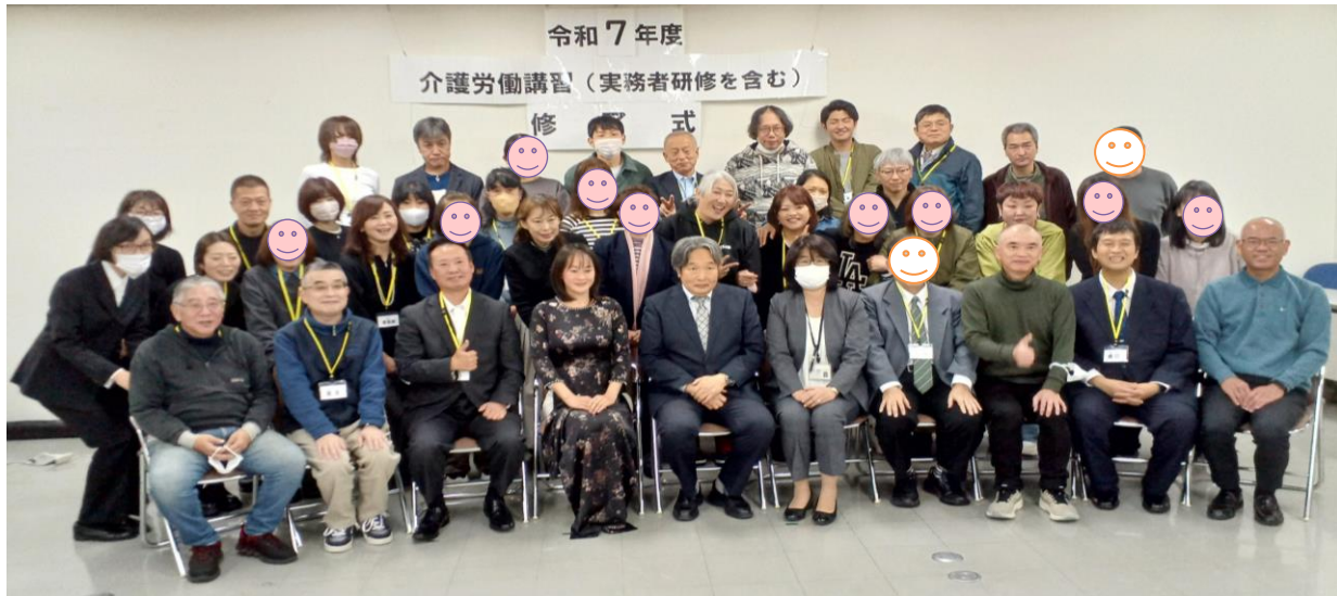
(公財) 介護労働講習安定センター奈良支部