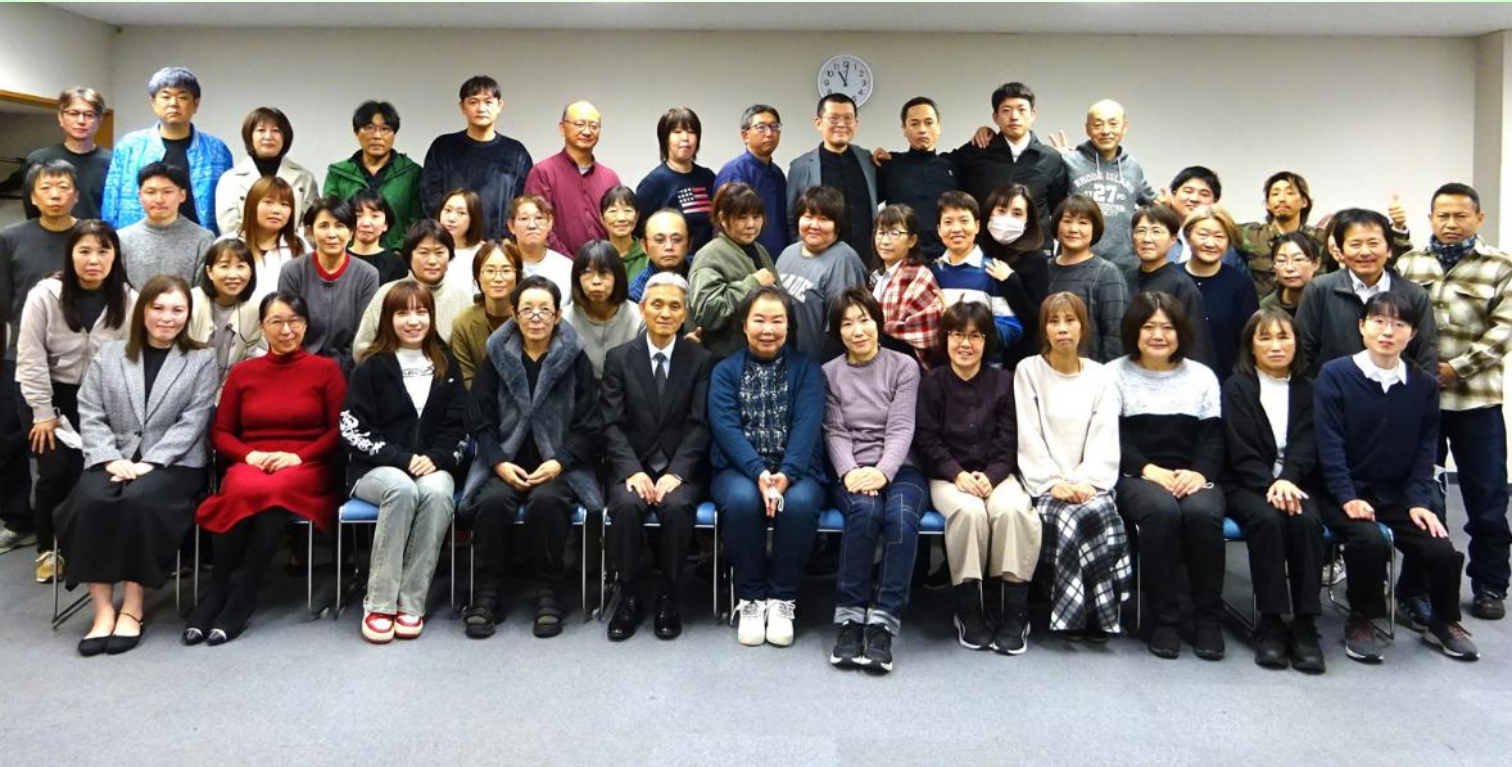
撮影時の短時間のみマスクを外しております