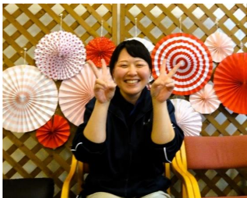
この笑顔に癒されるご利用者多数