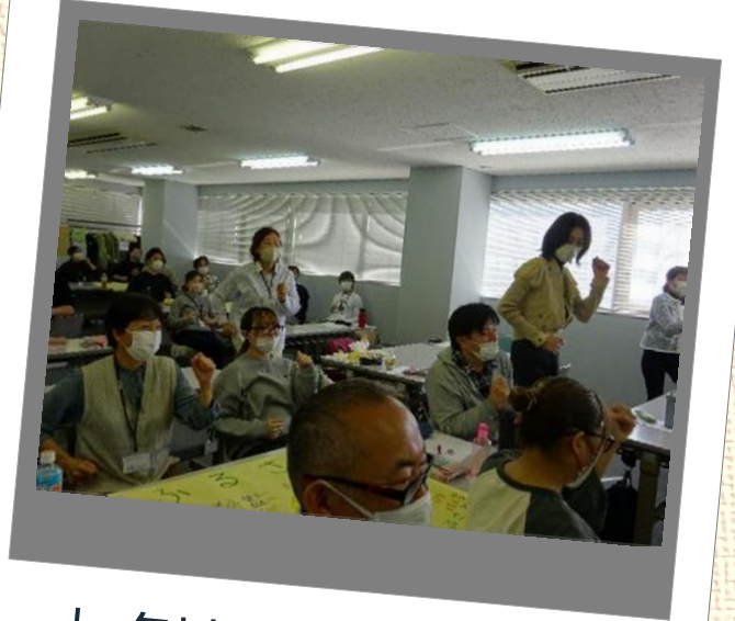
レクリエーション演習