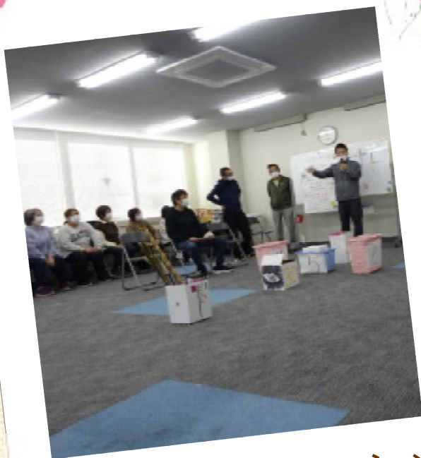
現場補足講習(レクリエーション)