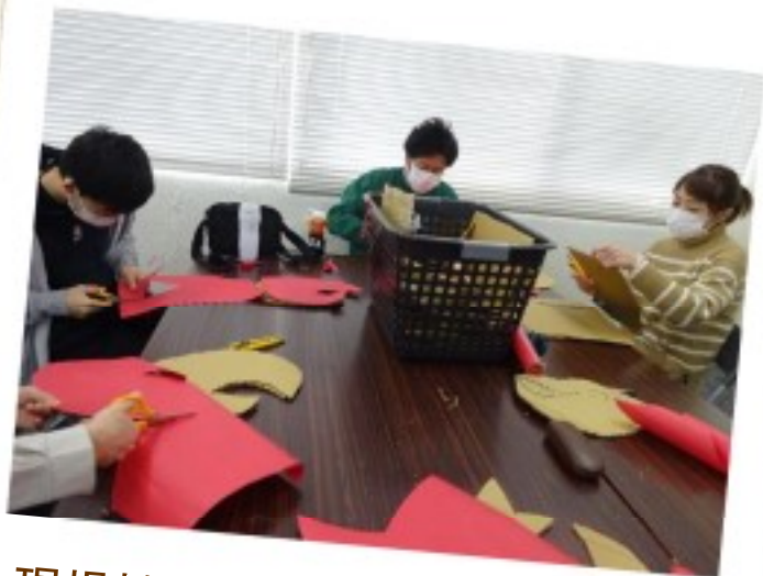
現場補足講習(レクリエーション)