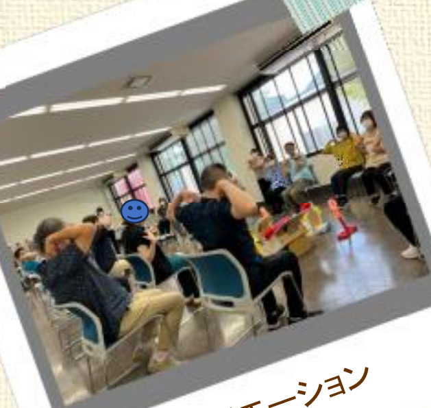
レクリエーション