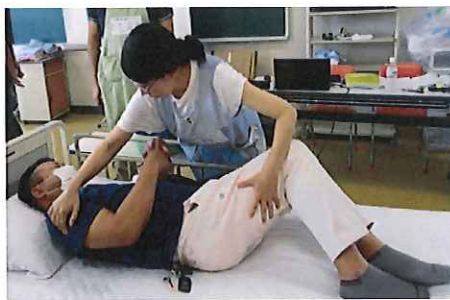
ベッド上での介助では、腰を痛めない技術も学びます。