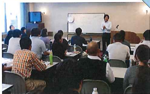
座学では、ホワイトボードやスライドを使いながら、講師が分かり易く解説してくれます。